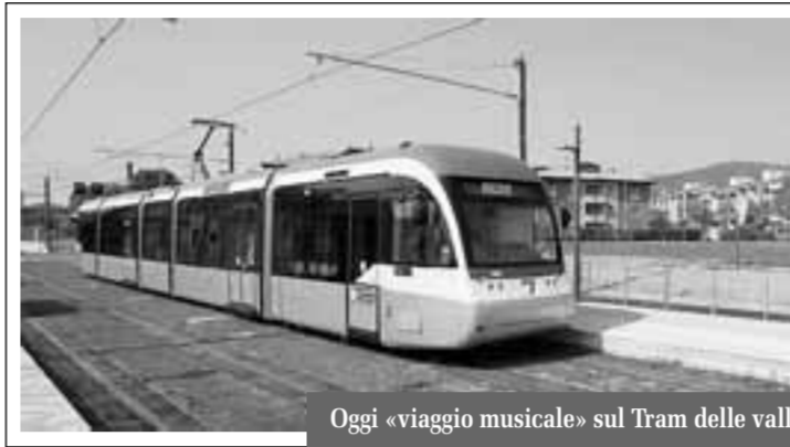
Oggi «viaggio musicale» sul Tram delle valli

Domani, invece, le piscine dell'impianto Italcementi di Bergamo saranno aperte al pubblico gratuitamente dalle 16 alle 24 per dare l'opportunità a tutti i visitatori di scoprire l'acqua a 360 gradi; non solo come forma di divertimento, sport e spettacolo, ma anche come valore assoluto, diritto insostituibile, presenza naturale, architettonica e artistica che qualifica le nostre città. Ci si potrà tuffare in piscina, partecipare alle lezioni di baby nuoto, acquagym, nuoto sincronizzato, tuffi, nuoto e pallanuoto, oltre ad assistere a spettacolari di tuffi e ai coreografici balletti di nuoto sincronizzato delle atlete di Asd Bergamo Nuoto. Non mancheranno la musica dal vivo e la possibilità di de-