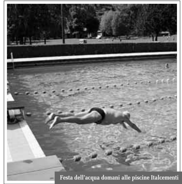
Festa dell'acqua domani alle piscine Italcementi

gustare cibi e bevande, tutti rigorosamente a base di acqua.